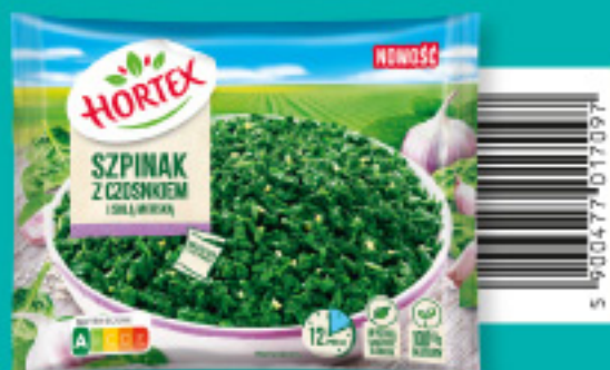
Szpinak z czosnkiem i solą morską 400 g Składniki: szpinak rozdrobniony, przyprawa w saszetce