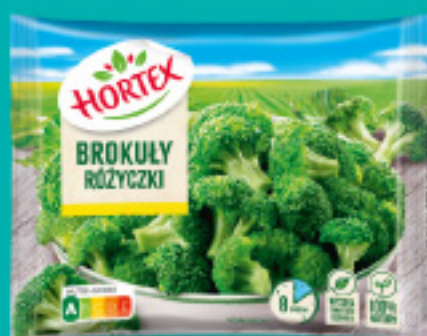
Brokuły różyczki 450 g