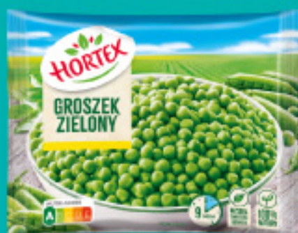
Groszek zielony 450 g