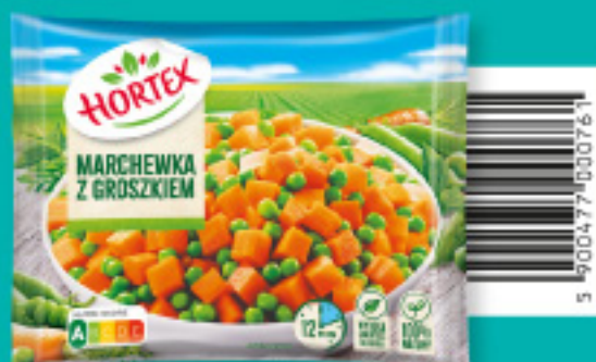
Marchewka z groszkiem 450 g

Składniki: marchew, seler, pietruszka, por