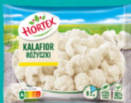
Kalafior różyczki 450 g