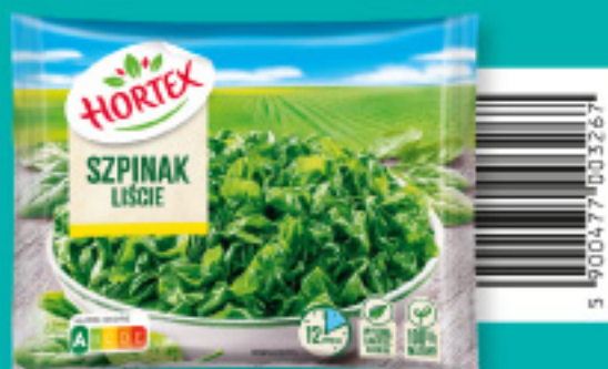
Szpinak liście 450 g