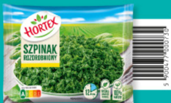
Szpinak rozdrobniony 450 g