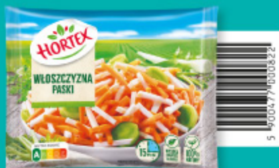
Włoszczyzna paski 450 g

Składniki: marchew, seler, pietruszka, por