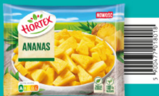
Ananas 300 g