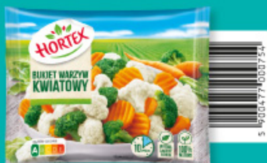
Bukiet warzyw kwiatowy 450 g

Składniki: kalafior, fasola szparagowa, marchew, kapusta brukselska, groch zielony