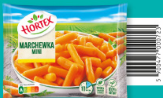
Marchewka mini 450 g