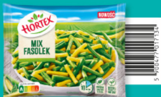
Mix fasolek 450 g

Składniki: fasola szparagowa zielona, fasola szparagowa żółta