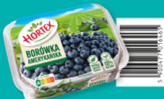
Borówka amerykańska 280 g