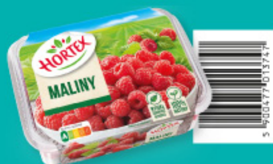
Maliny 280 g