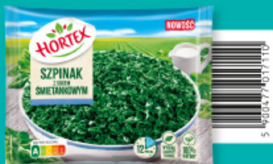
Szpinak z sosem śmietankowym 400 g Składniki: szpinak rozdrobniony, szpinak w sosie śmietankowym