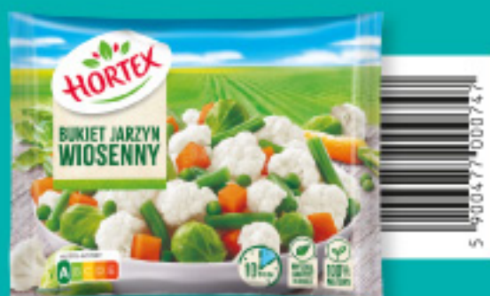
Bukiet jarzyn wiosenny 450 g

Składniki: kalafior, fasola szparagowa, marchew, kapusta brukselska, groch zielony