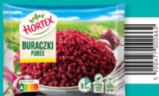
Buraczkę puree 450 g