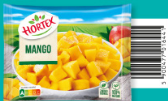
Mango 300 g