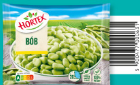
Bób 450 g