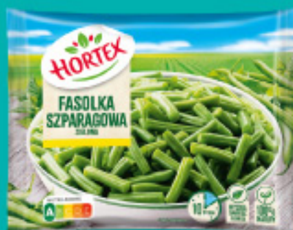
Fasolka szparagowa zielona 450 g