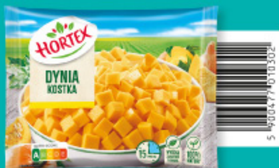
Dynia kostka 450 g