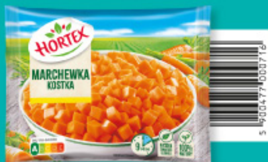
Marchewka kostka 450 g