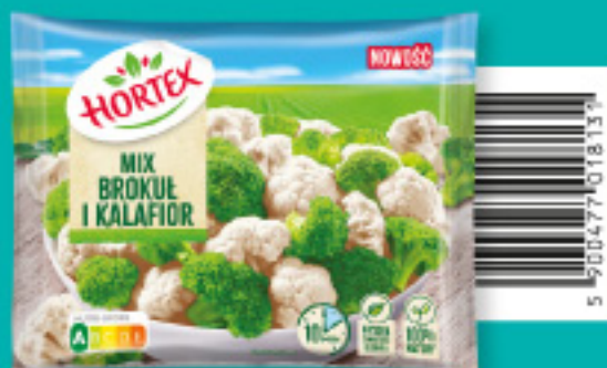
Mix brokuł i kalafior 450 g

Składniki: fasola szparagowa zielona, fasola szparagowa żółta