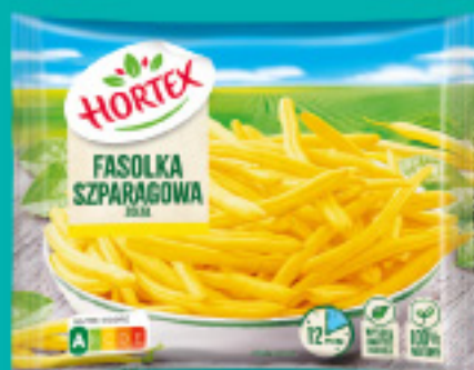
Fasolka szparagowa żółta 450 g