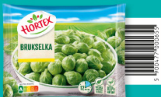
Brukselka 450 g Składniki: kapusta brukselska